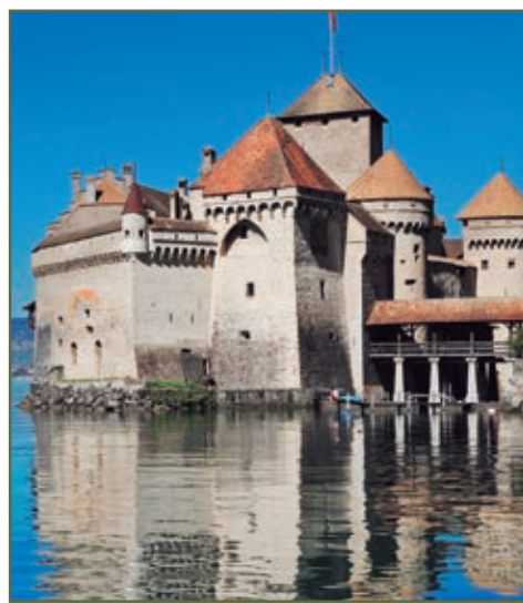
CASTILLO DE CHILLON

Conocemos LUGANO la cosmopolita capital de la Suiza Italiana junto a su hermoso lago. Tiempo para pasear. Tras ellos cruzamos por la autopista el paso de San Gotardo. Paramos en BURGLEN , el diminuto pueblo donde nació Guillermo Tell, veremos la capilla del siglo XVI con las pinturas que ilustran su vida, podrá conocer también, si lo desea, el museo de Guillermo Tell. En la vecina ciudad de ALTDORF también tendremos recuerdos de su historia. Continuación a LUCERNA , tiempo libre para conocer esta hermosísima ciudad junto al lago que tiene su nombre.